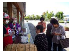
道の駅 新米試食会