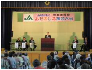
年金友の会総会・演芸大会