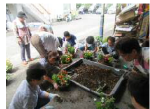
女性部 ガーデニング教室